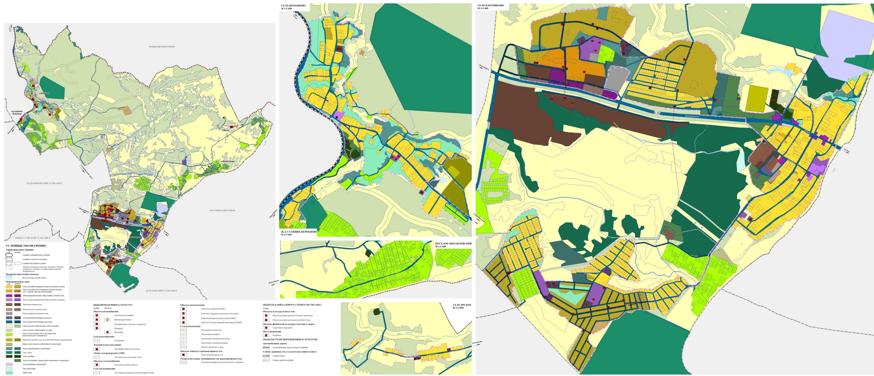
Карта планируемого размещения объектов местного значения поселения